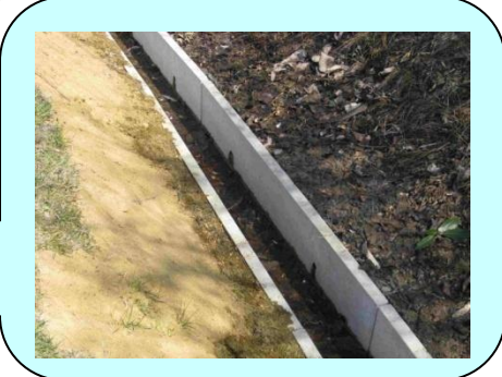
事務所名:宮城県仙台振興事務所 施工箇所:松島東部地区藤ノ巻工区排水路および暗渠排水工事 施工製品:排水フリューム300