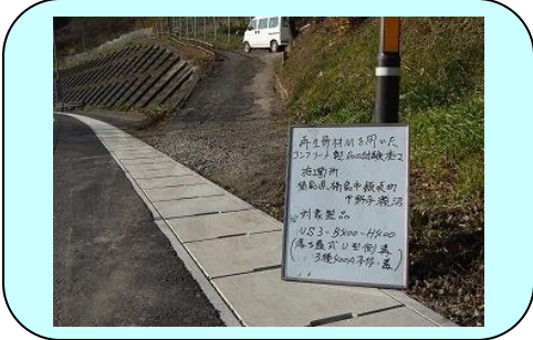
事務所名:福島河川国道事務所 栗子国道維持出張所 施工箇所:福島県福島市飯坂町中野地内 R13 11.4kp 施工製品:US3-B400-H400 (3種400A本体 & 蓋)