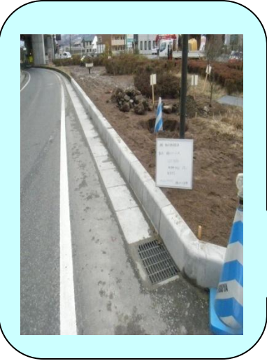
事務所名:山形河川国道事務所 施工箇所:山形県山形市飯田地内 施工製品:LS2-h250 L=0.6m/本

宮城大学食産業学部建設環境材料学(北辻)研究室 TEL.022-245-1426,E-メール:kitatsuj@myu.ac.jp