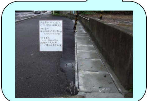
事務所名:郡山国道事務所郡山維持出張所 施工箇所:福島県須賀川市滑川字西山 施工製品:US2-B300-H300