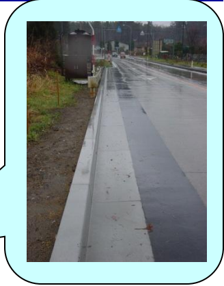
事務所名:青森河川国道事務所 施工箇所:三戸郡階上町字後口 R45 395k 施工製品:LS2-h200