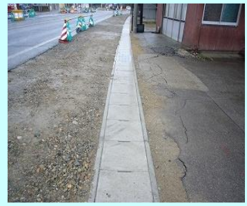
事務所名:郡山国道事務所 会津若松出張所 施工箇所:福島県河沼郡会津坂下地内 施工製品:US2 & US3-B400-H400